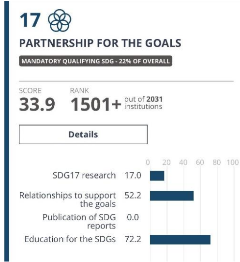
Resim 1: THE - Amaçlar İçin Ortaklıklar Amacı Sıralaması